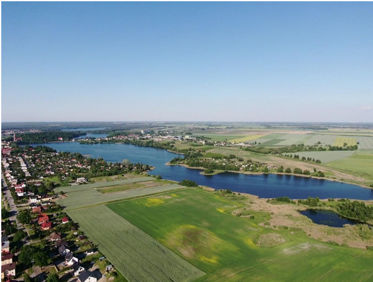
Jez. Urzędowe od strony południowo-zachodniej.